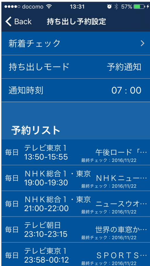
<①持ち出し設定画面>